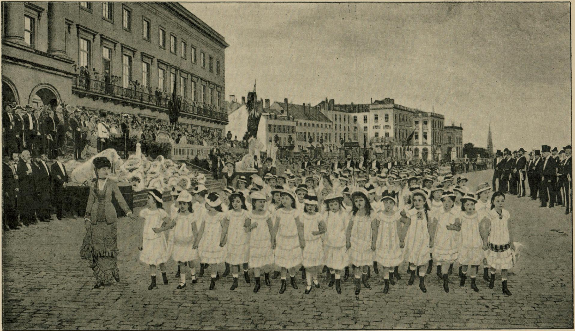
LA REVUE DES ÉCOLES, 23 AOUT 1878 Musée royal de peinture moderne. — Tableau de Jan Verhas.